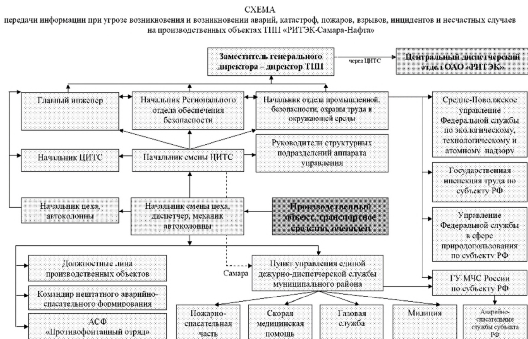
Схема 1. Схема организации взаимодействия, связи и оповещения в случае возникновения ЧС.

Общее руководство гражданской обороной в ООО «РИТЭК» осуществляет генеральный директор. Для оповещения персонала проектируемых сооружений по сигналам гражданской обороны предусматривается использовать существующую систему оповещения ООО «РИТЭК». Схема организации взаимодействия, связи и оповещения ТПП «РИТЭК-Самара-Нафта» в случае возникновения ЧС, представленная заказчиком, приведена на схеме 1.